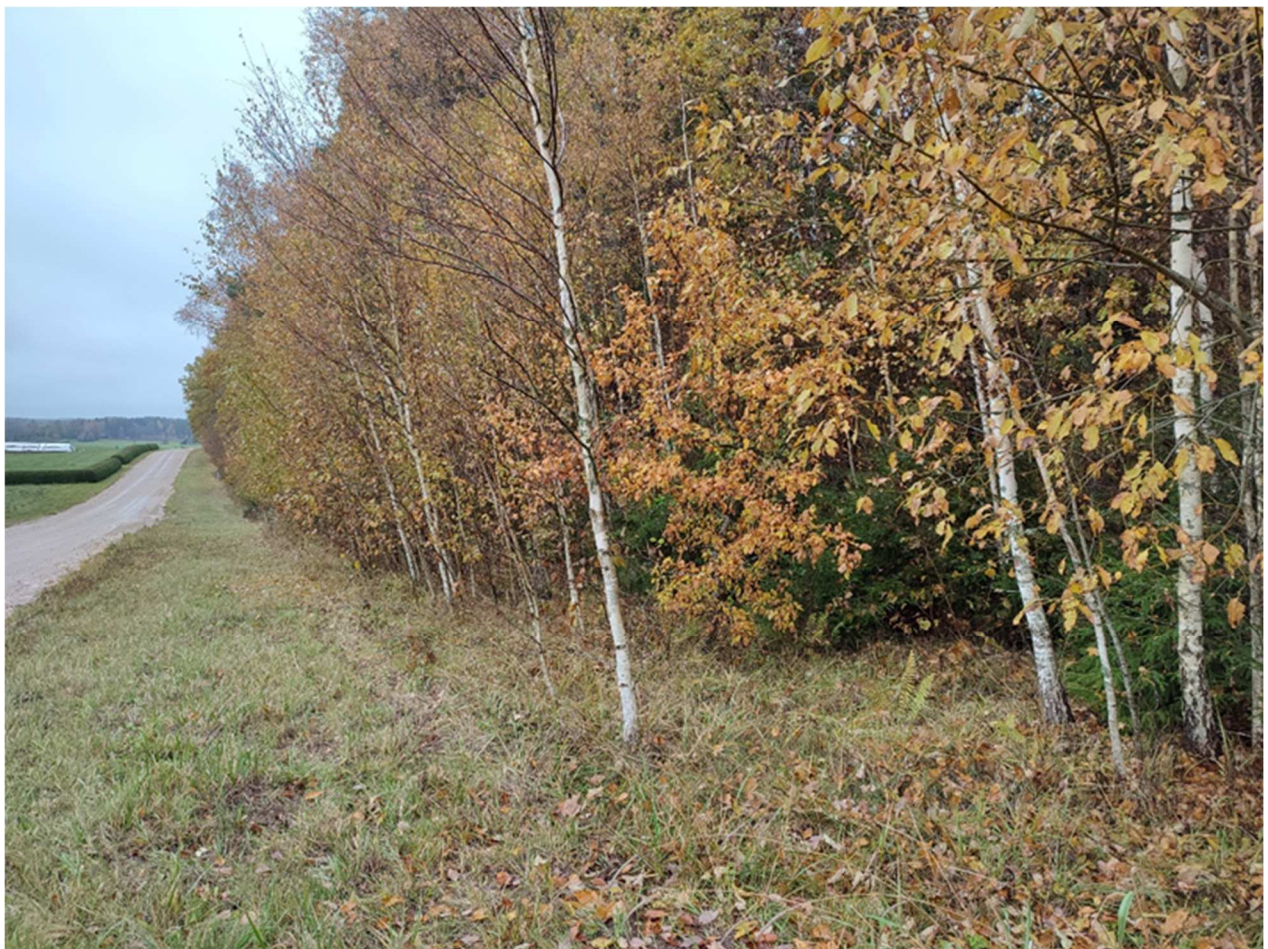
Foto 5. Soovitatav ala uueks parkimisalaks (maapind langusega põhja suunas).