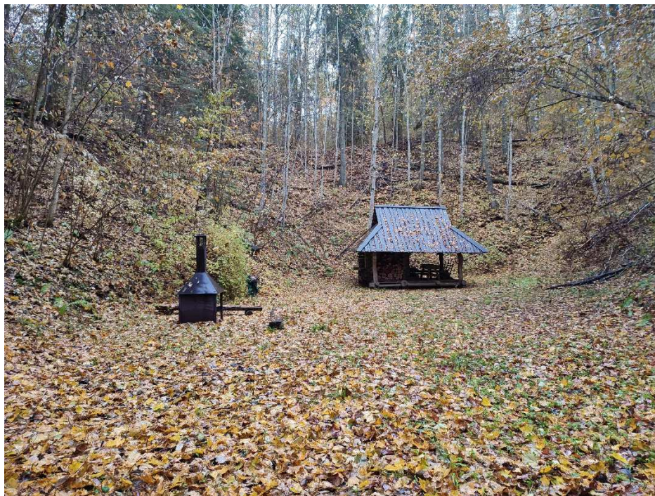
Foto 14. Lõkkekoht Juudaorus (kinnine lõkkealus, varjualune, prügikast, puidust istepingid)