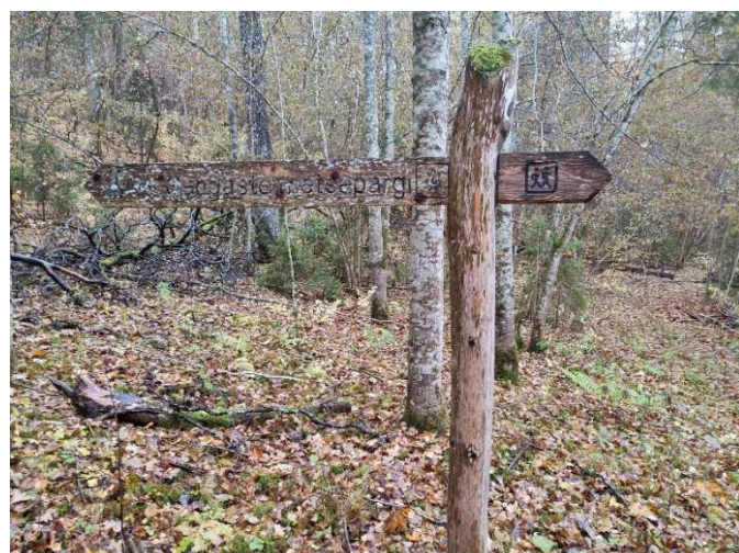
Fotod 10-11. Puidust väikevormid metsapargis (teeviidad, istepink), metallist pargi tähis