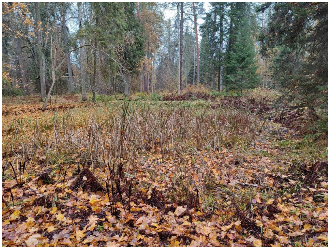
Pilet 16. Luisa tiik metsapargi lõunapoolses osas