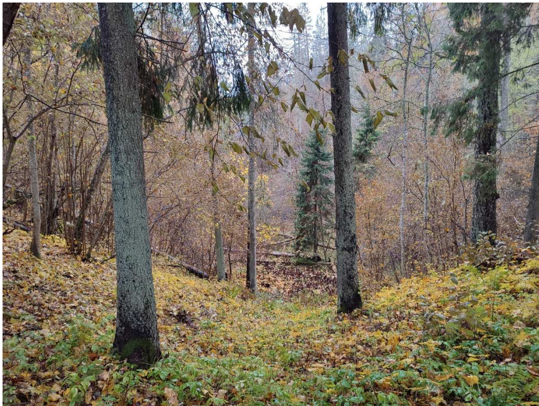
Foto 15. Oluline vaatekoht ja-siht Juudaoru suunas (tõenäoline mõisaaegse kivitrepi asukoht)