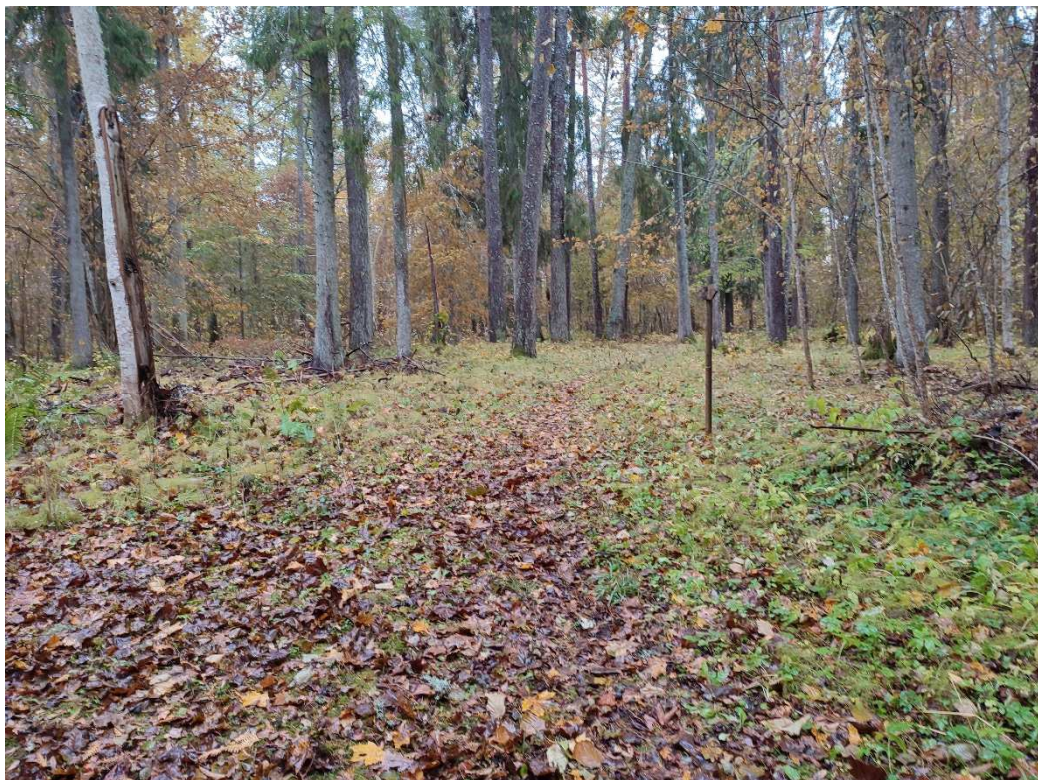
Foto 2. Sissetallatud kitsam rada metsapargi osas