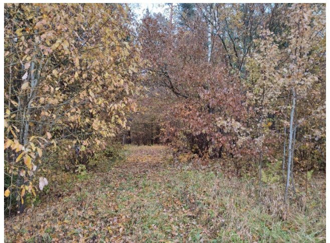
Fotod 3-4. Riigimaanteelt uue sissepääsukoht metsaparki.