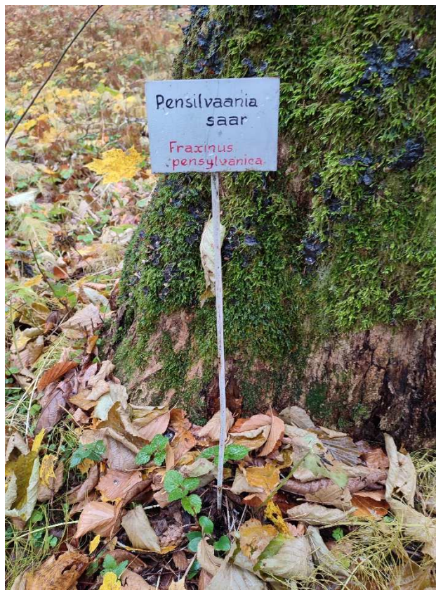
Fotod 12-13. Väikevormid metsapargis (puidust infotahvel, metallist infoalus)