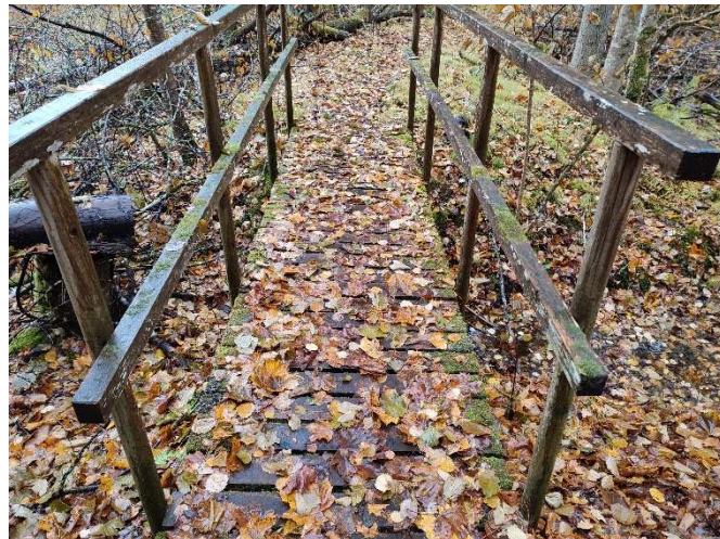
Fotod 6-7. Amortiseerunud sillad metsapargi osas