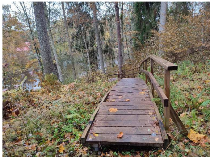
Fotod 8-9. Amortiseerunud (maastiku)trepid metsapargi osas